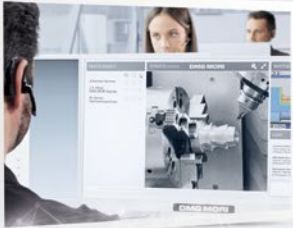
Línea directa de servicio