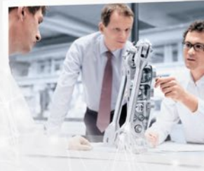
Técnica de aplicación